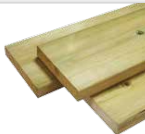
LISSE Vert : PT4FLF-28x145 Brun : PT4FLBF-28x145