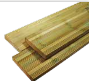
STRIÉE Vert : PTT4F-28x145 Brun : PTTBF-28x145