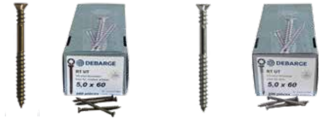
Marron : VIA2M-50x60

Vis pour terrasse en INOX A2 Couleur : Marron/Brut Dimensions : 5,0x60 Boîte de 200 pièces Pointe anti-fendage